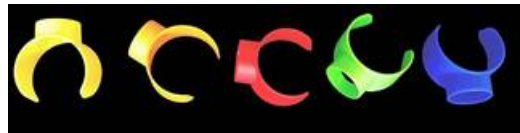
Pulvérisateur avec bagues:

Bagues en 5 couleurs pour pulvérisateur, kit de 5 bagues (bleu-vert-rouge-jaune-orange). Affiche de marquage (format A3) disponible, pour marquer avec quel produit chimique chaque couleur correspond.